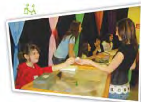
Les partenaires de Mag'Aubier sont toujours fiers d'offrir les produits de leur créativité.

Grâce à cette approche, des élèves ont créé le magasin général Mag'Aubier, issu de l'incubateur de micro-entreprise de l'institution d'enseignement. La réalisation de ce projet marque l'adhésion de l'école l'Aubier au Réseau québécois des écoles entrepreneuriales et environnementales. Cinq micro-entreprises forment le magasin général : Le Bullebier, spécialisé dans la confection de savons et de porte-savons artisanaux 100 % naturels; Papier 06-07 qui contribue à protéger l'environnement en récupérant les papiers usagés de l'école et en les