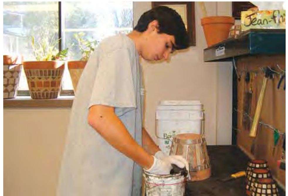
Élève de la Jeune Coop À fleur de pots au travail. Cette entreprise, créée par six jeunes de 13 à 18 ans, de la polyvalente Sainte-Thérèse dans les Laurentides, a gagné le prix de la Relève en action dans la catégorie Rayonnement et engagement dans la communauté de la Fondation pour l'éducation à la coopération.

Choyés, les jeunes de toutes les régions du Québec peuvent dorénavant compter sur la présence d'un agent de promotion à l'entrepreneuriat collectif jeunesse dans leur entourage, un service dont Mme Lavoie est