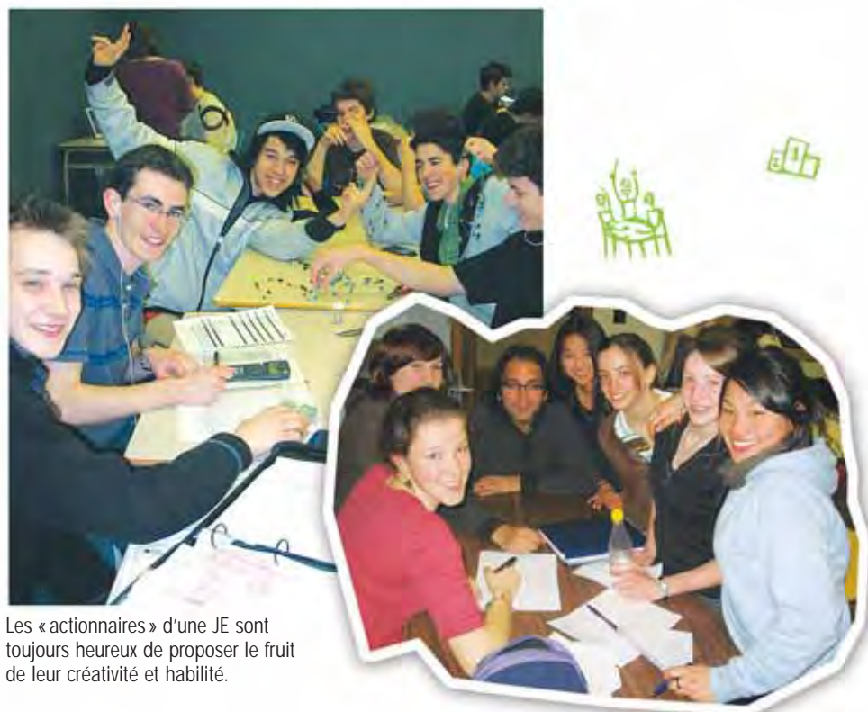
Les « actionnaires » d'une JE sont toujours heureux de proposer le fruit de leur créativité et habilité.

Le rôle des JE est si important que dans certaines écoles, certains programmes de l'organisme ne sont plus considérés comme