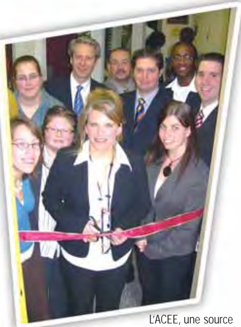
L'ACEE, une source d'inspiration dynamique qui se répand dans le monde entier.

Reste que maintenant elle peut constater que bien des jeunes qui ont vécu l'aventure des clubs créent aujourd'hui des entreprises, participent activement à leur gestion ou