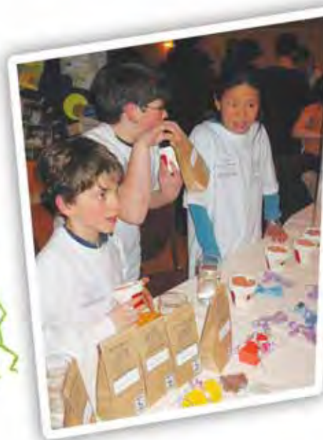
Les jeunes entrepreneurs assimilent aussi l'implication sociale et environnementale, comme ici en vendant du café équitable.