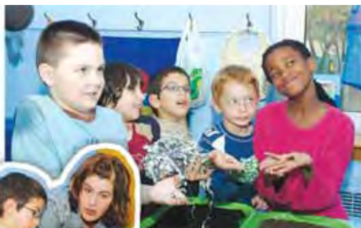
Des élèves du 1 er cycle primaire de l'école des Quatre-Vents de Sherbrooke ont réalisé un projet de vermicompostage afin de réduire les déchets de l'école et de financer leurs sorties éducatives.

Les écoles secondaires disposeront bientôt d'un portfolio fortement documenté pour les aider dans leur tâche, sans surcharge de travail. Cet ouvrage unique est présentement en processus d'approbation par les instances ministérielles et devrait être disponible en janvier prochain.