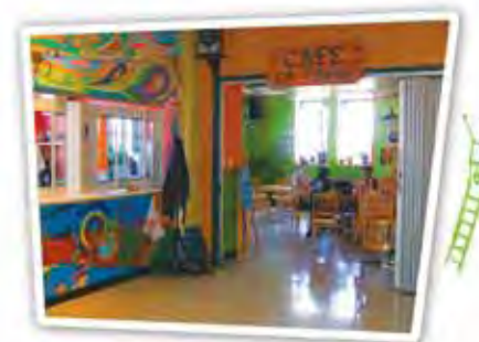
Les coopérateurs d'une nouvelle coopérative au cégep La Pocatière ne sont pas peu fiers d'inaugurer leur Café de la Tasse à l'occasion de la Journée internationale de la culture entrepreneuriale 2007.

Quelle journée mémorable que ce 16 novembre 2007 pour le cégep de La Pocatière! Cette institution du Bas-Saint-Laurent qui invite « à changer d'air » se targue d'être le repère des jeunes de la région. L'institution met le cap sur la réussite et l'excellence et stimule depuis belle lurette la mise en valeur des habiletés entrepreneuriales.